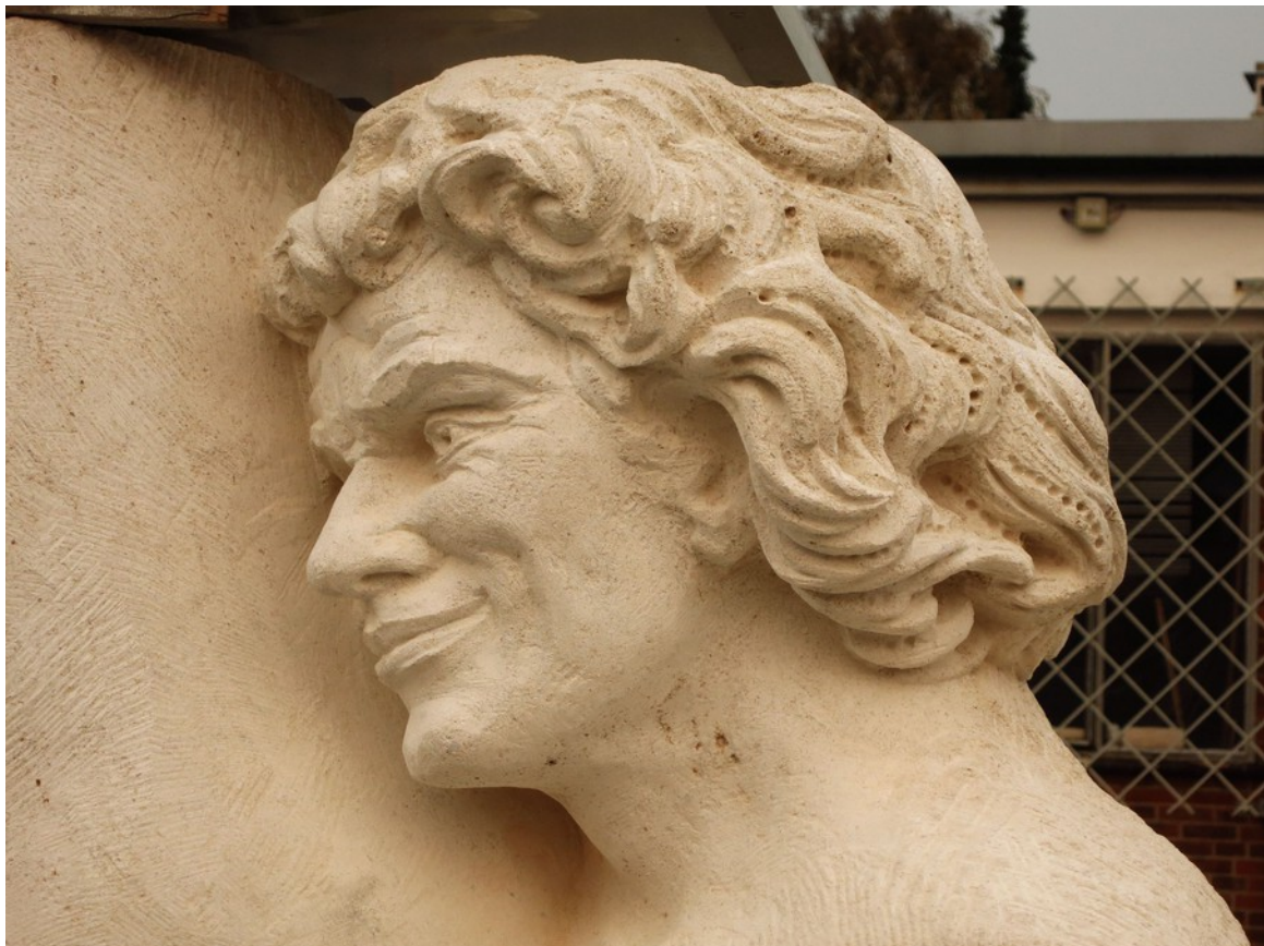
„Josef oder auch der Engel Gabriel“, Sola Gratia, Muschelkalk, Groß Denkte, 2017