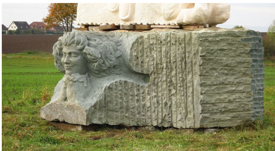
Sola Gratia, Anröchter, Groß Denkte, 2017

Maria aus der „Gnadengruppe Sola Gratia“ ist eine sinnliche Frau, die dem neuen Leben in ihr ganz zugewandt erscheint, und daher ist Joseph hier mit einem Mal ein Fröhlicher, keine Nebenfigur mehr. Ein Engel mit Lockenhaar liegt sinnend darunter, weiß um die menschlichen Schwächen. Das schafft Identitäten mit dem Betrachter und regt zum Weiterschauen und zur Vertiefung in die Detailfülle der Figuren an.