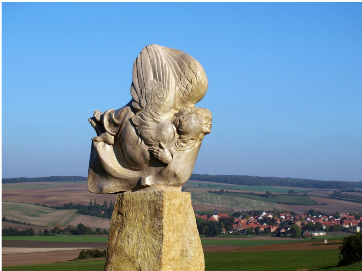
Sola Fide, Korallenoolith, „Kleiner Fallstein“ bei Hornburg, 2015

zwei selig aneinander geschmiegte Engel vermitteln den Glauben