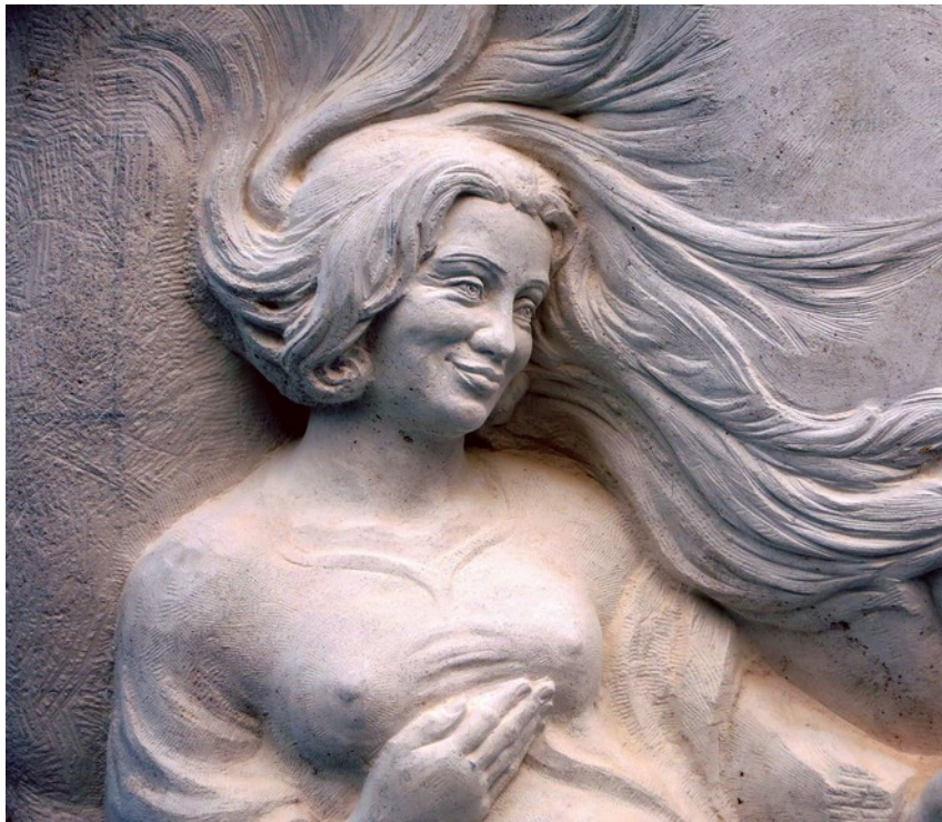
Sola Gratia, Muschelkalk, Groß Denkte, 2017

Die eindrucksvolle Größe der Skulpturen, unabhängig von den Materialien Holz, Sandstein, Marmor, Kalk- und Kalksandstein, ermöglichten die feine sinnliche Detaillierung: ruhende und lächelnde Mimik, elastische Glieder, schwellende Adern, wehende Haarsträhnen, gestutzter Bart, Gefieder: alles ist ablesbar.