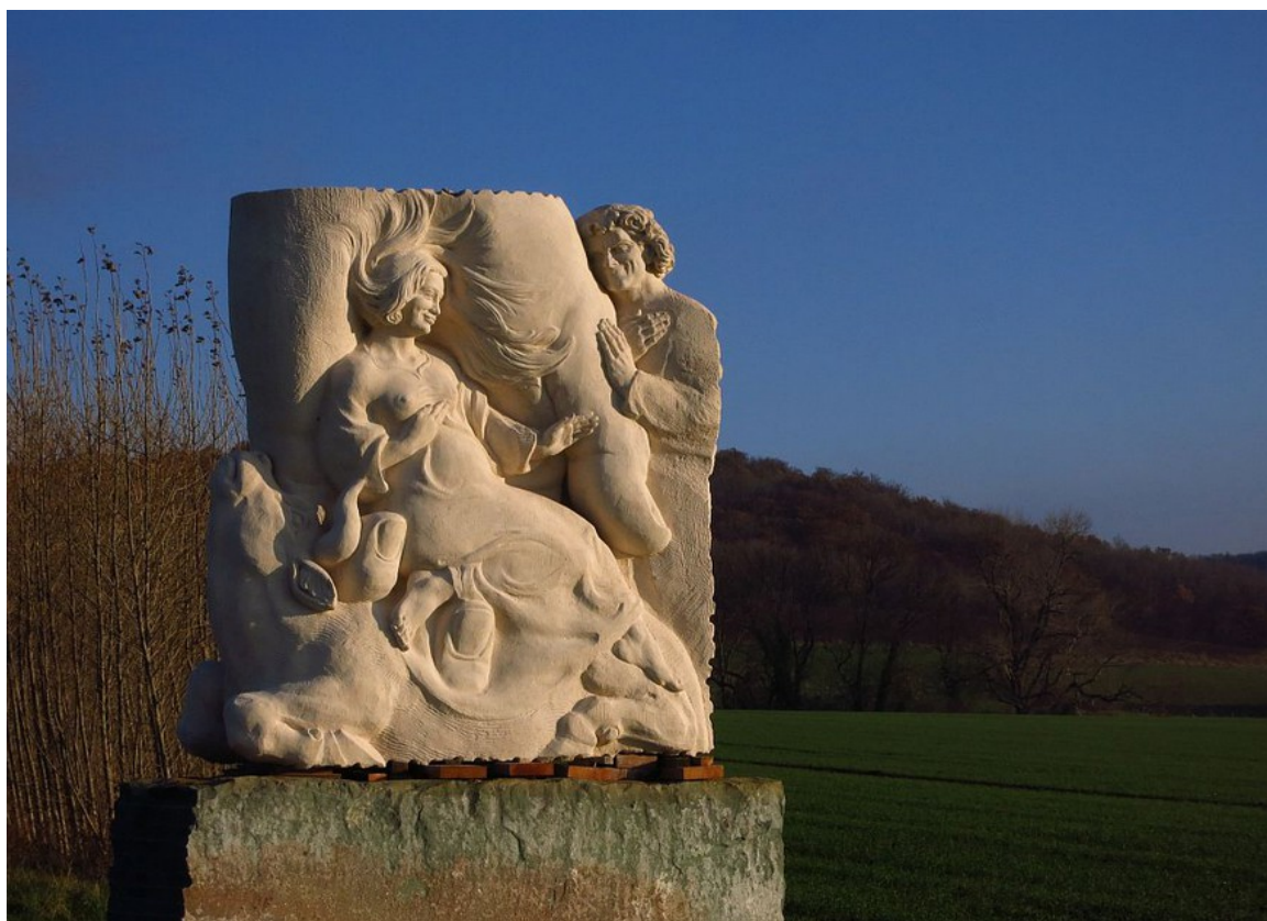
Sola Gratia, Muschelkalk und Anröchter, Groß Denkte, 2017

Dort fährt die große „Hand Gottes“ zwischen das Menschenpaar aus Altem und Jungem und lastet auf einem Stier. Auf der Rückseite ist eine Schwangere in Gottes Hand.