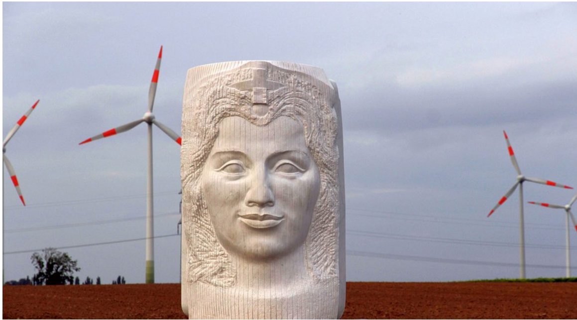
Sola Scriptura, Marmor, Salzgitter Lesse, 2016

ein jugendliches, vergeistigtes Haupt steht für die heilige Schrift,