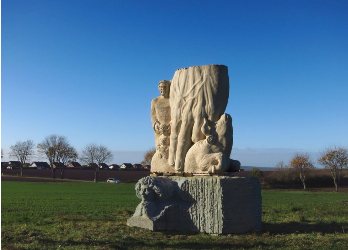
Sola Gratia, Muschelkalk und Anröchter, Groß Denkte, 2017

Dort fährt die große „Hand Gottes“ zwischen das Menschenpaar aus Altem und Jungem und lastet auf einem Stier. Auf der Rückseite ist eine Schwangere in Gottes Hand.