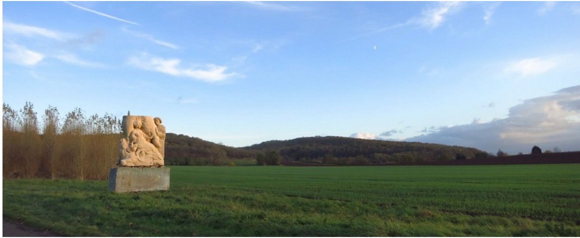
Sola Gratia, Muschelkalk und Anröchter, Groß Denkte, 2017

Die Umriss werden im weiteren Schaffensprozeß vom Bildhauer beibehalten, aber je nach Lichtwirkung gegen den freien Horizont verbessert und hiernach die Binnendetails in ihrer Klarheit ausgeformt. Kleine-Tebbes Kunstwerke, diese handwerklich in Holz und Stein (!) sauber gearbeiteten, höchst verdichteten Stücke von Leben auf der Grundlage des evangelischen Glaubens, spiegeln ihre evangelischen Kernaussagen auf geradezu internationale Art wider.