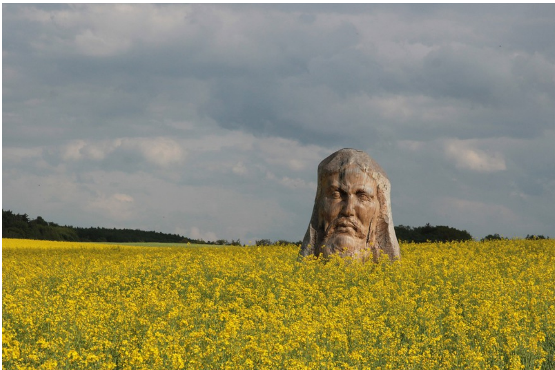
Jesus Christus in Hornburg, Eichenholz, 2012