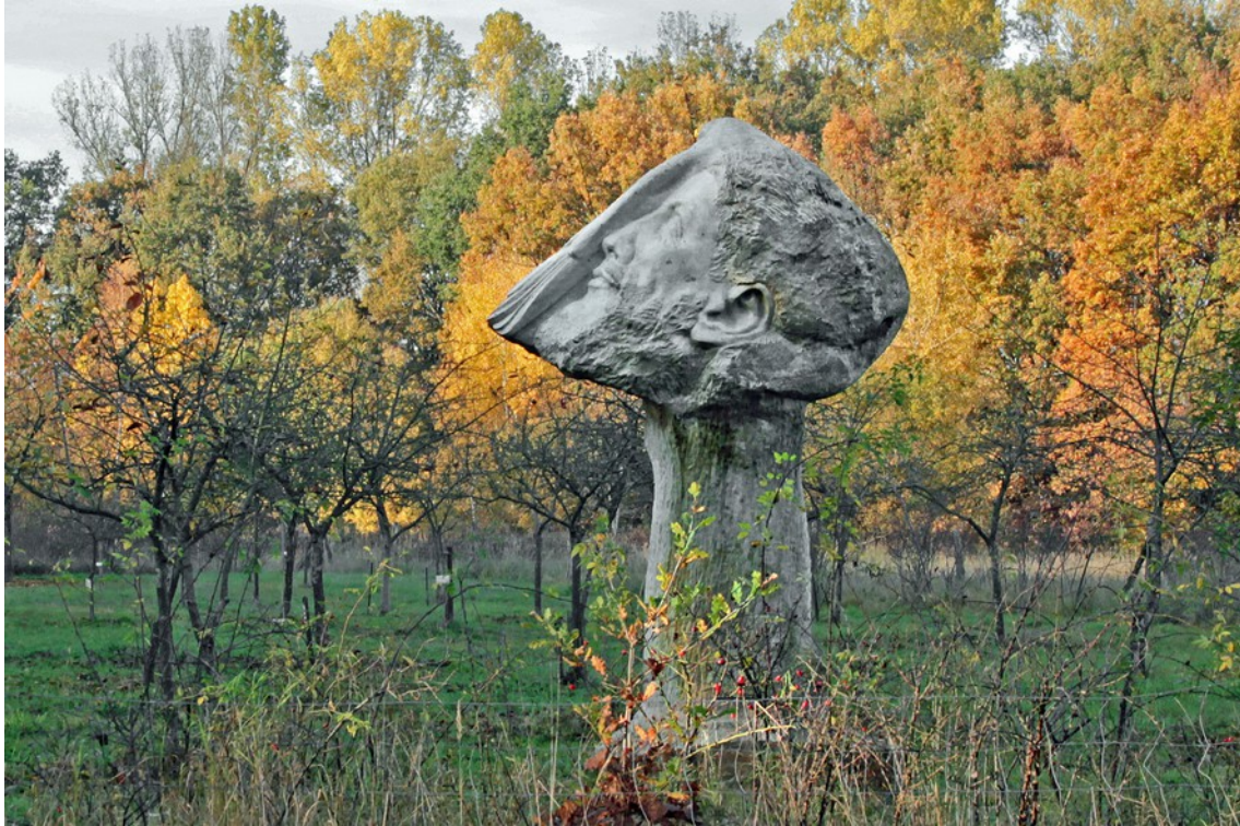
Jesus Lebensbaum, Sandstein, Bienrode, 2014

Jesus Christus ist zweimal vertreten: als milder bärtiger Männerkopf voller Gnaden und in Großform mit Schmerzengesicht der Passion (aus Eichenholz);