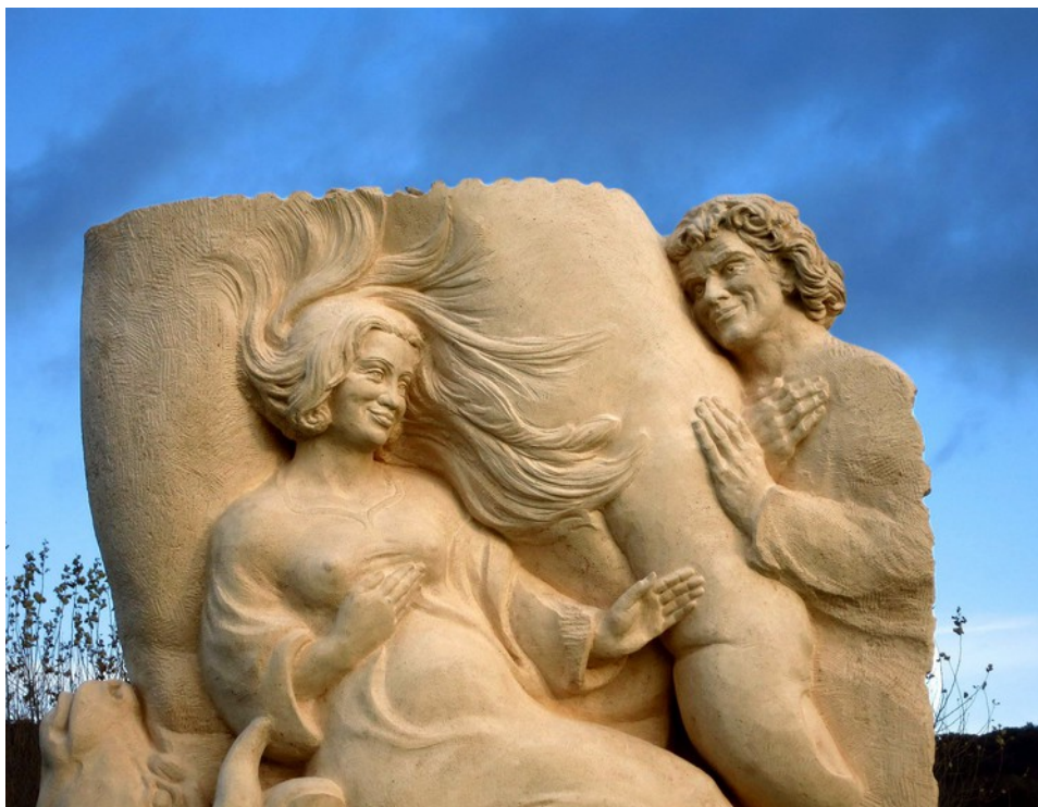
Sola Gratia, Muschelkalk, Groß Denkte, 2017

Aber zugleich sind die Figuren neu erdacht, frisch; z. B. wirkt das Christusprofil wie die Erinnerung an einen guten Bekannten und die „Bibel“ erscheint als junges lernendes Haupt.