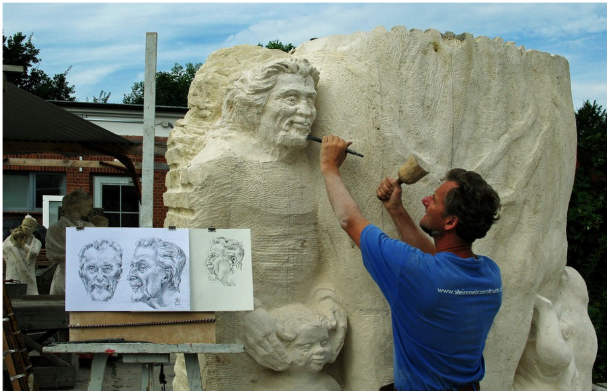
Portratarbeit am Großvater in „Sola Gratia“

Das fränkische Nürnberg wählte ich als Studienort, weil mich die beiden spätgotischen Bildhauer Veit Stoß und Till Riemenschneider und die Grafiken Albrecht Dürers begeisterten.