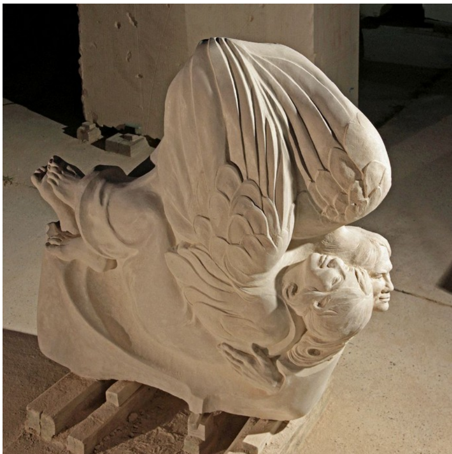
Sola Fide, Korallenoolith, „Kleiner Fallstein“ bei Hornburg, 2015