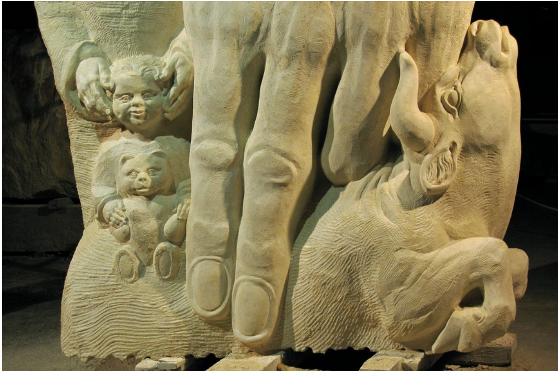
Sola Gratia, Muschelkalk, Groß Denkte, 2017

Das ist in der Gegenwartsplastik nicht selbstverständlich, die sich eher einer klaren Aussage entzieht, ein „alles ist möglich“ anstrebt und den Betrachter ratlos zurücklässt. Kleine-Tebbe äußert sich eindeutig, reduziert subtil und schafft wie z. B. bei der „Gnade“ Figurenbühnen. Dort verknüpft er die Aussagen aufs Wichtigste, um dann umso eindeutiger den tragenden Stier und das selige, geborgene Kind mit seinem geliebten Stofftier zu zeigen.