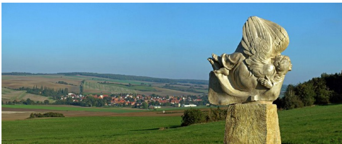
Sola Fide, Korallenoolith, „Kleiner Fallstein“ bei Hornburg, 2015

Der große Umriss gegen den freien Horizont ist die Leitlinie des Entwurfs, der von einem Tonmodell im kleinen Maßstab 1:5 ausgeht. Die Figuren ohne einen städtischen Umraum, der sie optisch einbinden, „festhalten“, würde, benötigen diese Selbstbindung, ihre runden, ovalen oder eckig geschlossenen Umrisse. Dadurch bringen sie ihre eigne architekturnliche Bindung mit, die sie gegen die Weite ihrer Umgebung bestehen läßt.